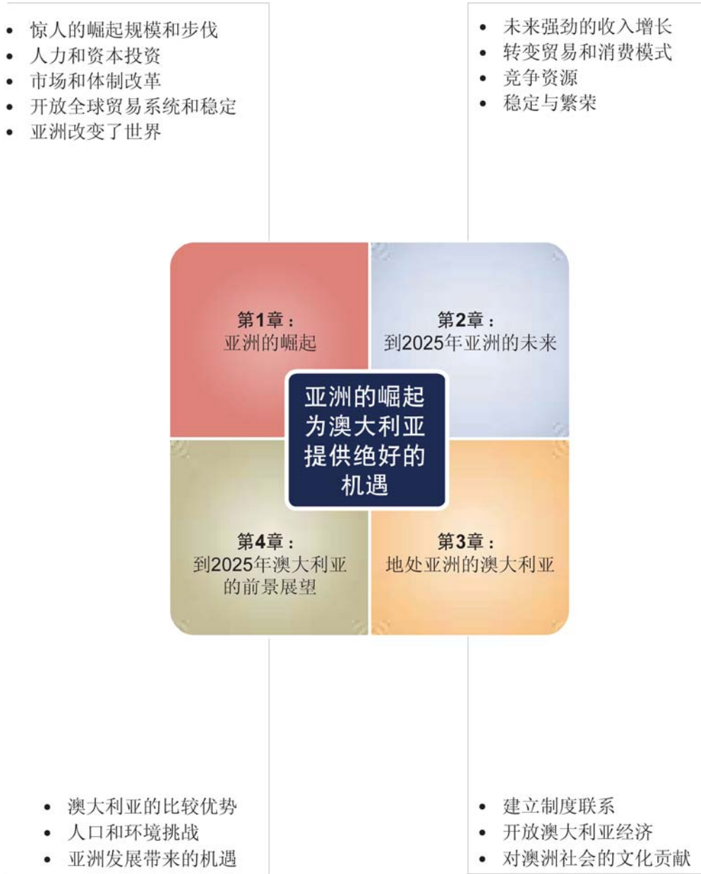
图示 1：设置亚洲世纪的背景